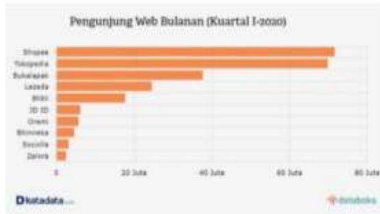
Gambar 1.2 Pengguna E-Commerce di Indonesia 4

unduh aplikasi dan lebih dari 180 juta produk aktif dari lebih dari empat juta wirausaha. Kemudian di Indonesia sendiri Shopee menjadi e-commerce yang paling banyak dikunjungi pada tahun 2020 sebagaimana data berikut.