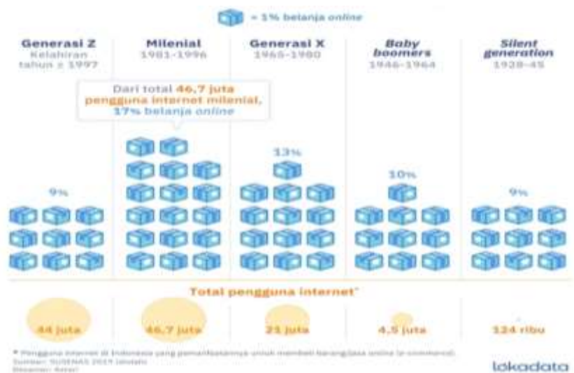
GAMBAR 1.3 Preferensi belanja online menurut generasi 5

Berdasarkan dalil-dalil diatas dapat diketahui bahwa kegiatan jual beli merupakan kegiatan ekonomi yang yang rentan akan kecurangan yang dapat merugikan pihak lain. Oleh karena itu jual beli hanya di perbolehkan jika sesuai dengan syari'at. Selain itu kecurangan dapat dihindari jika kualitas informasi yang di berikan penjual dan yang di dapatkan oleh pembeli berjalan dengan baik dan jujur. Maka dari itu penulis ingin mengangkat topik penelitian kualitas informasi dalam jual beli online.